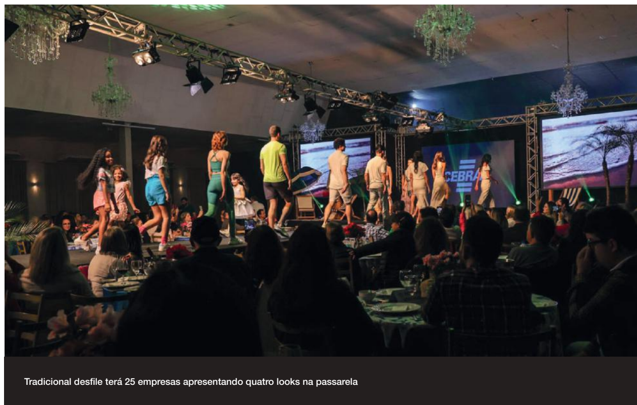
Tradicional desfile terá 25 empresas apresentando quatro looks na passarela

De acordo com Schoening, a meta da organização é atingir 800 mil peças comercializadas na edição da Pronegócio de Alto Verão 2025, já que a edição de maio deste ano, onde foi apresentada a coleção de Primavera/Verão, teve 1 milhão de