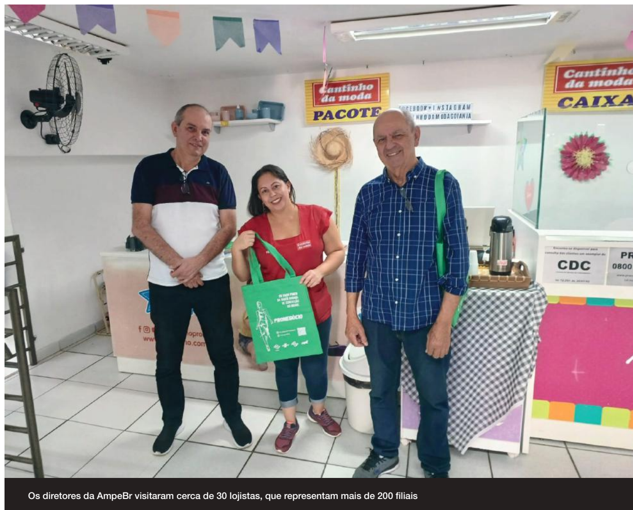
Os diretores da AmpeBr visitaram cerca de 30 lojistas, que representam mais de 200 filiais

A 67ª Pronegócio acontece de 12 a 15 de agosto, no Pavilhão da Fenarrec, em Brusque (SC) e apresenta a coleção Alto Verão 2025. O evento é exclusivo para lojistas e fabricantes de confecção de Santa Catarina. Mais informações: (47) 3351-3811.