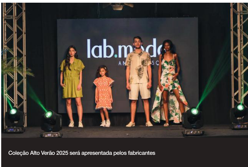
Coleção Alto Verão 2025 será apresentada pelos fabricantes

O tradicional desfile da 67ª Pronegócio será realizado na terça-feira, 13 de agosto, na Sociedade Santos Dumont. Na passarela, serão apresentados quatro looks da coleção Alto Verão, de 25 empresas fabricantes participantes do evento, nos segmentos feminino, masculino e infantil. O objetivo do desfile é fazer com que os compradores consigam visualizar melhor as peças e também fomentar as vendas.