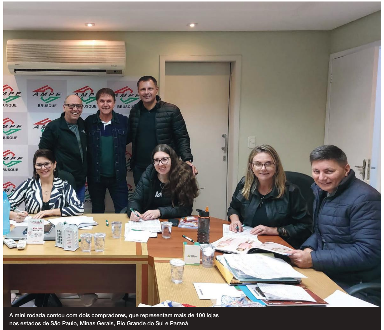
A mini rodada contou com dois compradores, que representam mais de 100 lojas nos estados de São Paulo, Minas Gerais, Rio Grande do Sul e Paraná

“Estamos muito satisfeitos, conseguimos atender um ótimo número de fornecedores, inclusive passamos para