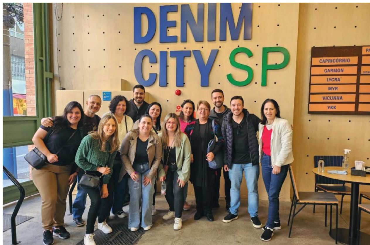
A missão teve o objetivo de promover aos empresários o acesso a novos mercados, além de conhecer novos fornecedores e clientes