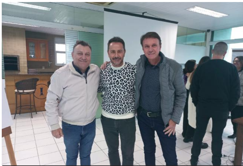
O Workshop de Internacionalização para a indústria têxtil, de confecção, couro e calçados, foi promovido pela Federação das Indústrias de Santa Catarina (Fiesc)

Evento realizado em Itajaí contou com diversas palestras sobre o tema